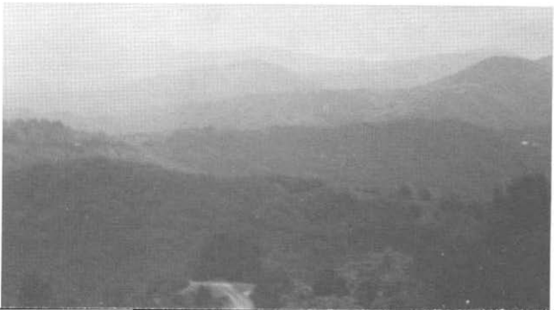
Панорама јоречких њанина и шума – царска војвода и њихових четиника