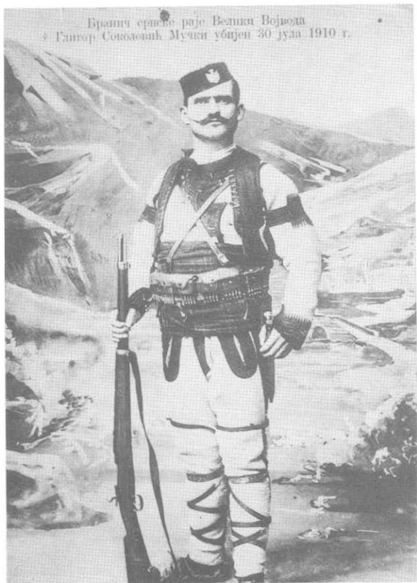
Велики војвода Глигор Соколовић