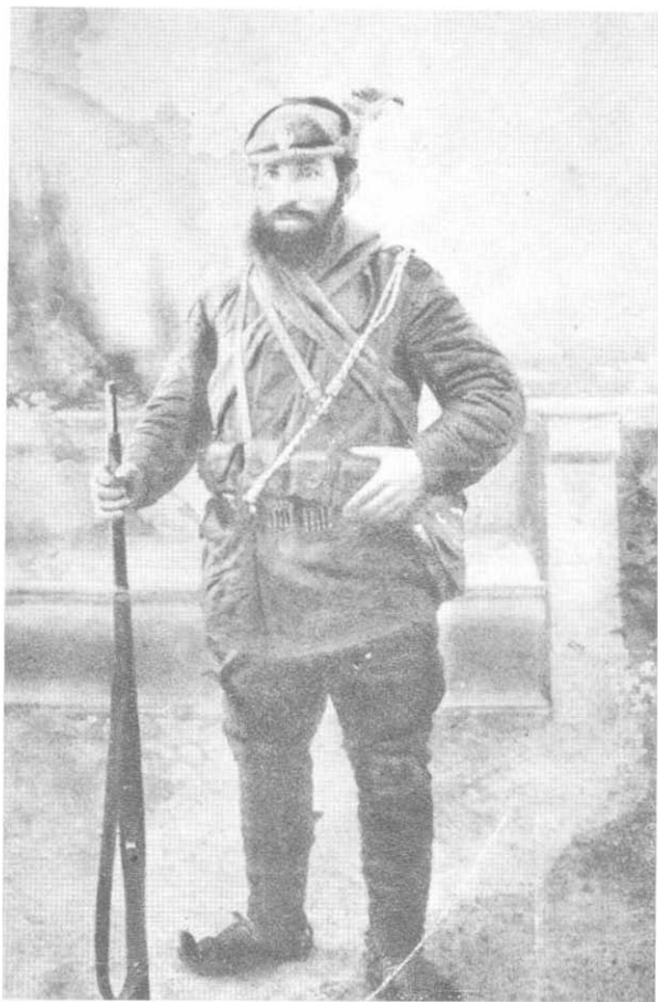
Војвода Јован Сијанојковић – Довезенски