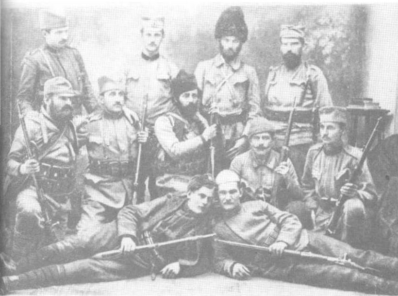
Четири војводе Воје Танкосића (1915. год.)