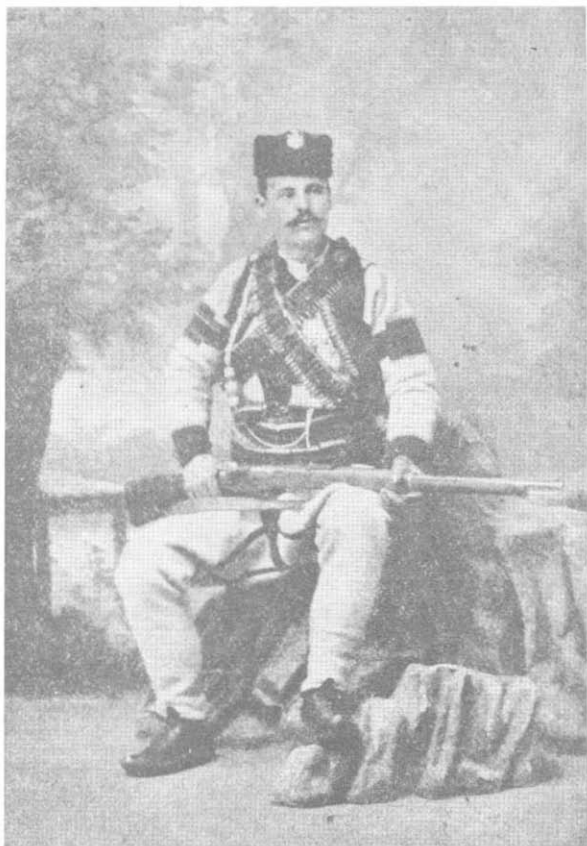
Војвода Јован Бабунски