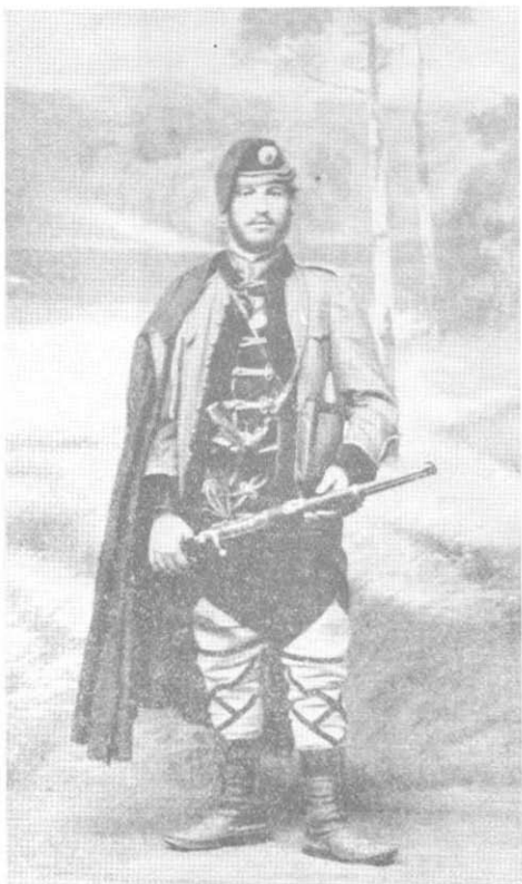
Војвода Ђорђе Скојланче