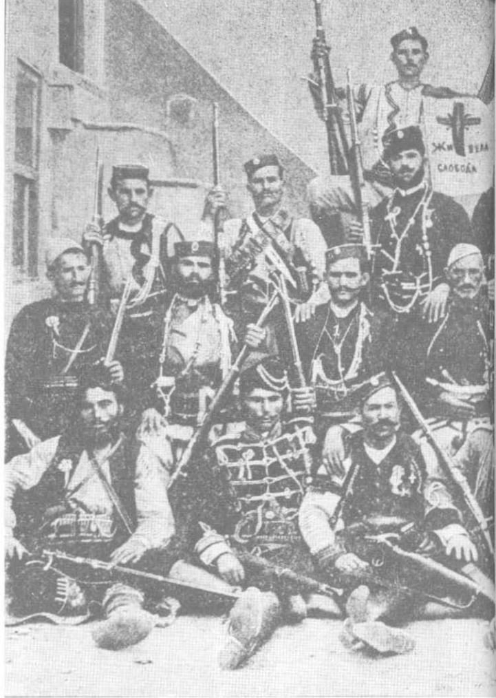
Српске македонске војводе – у Скопљу, 1908. године