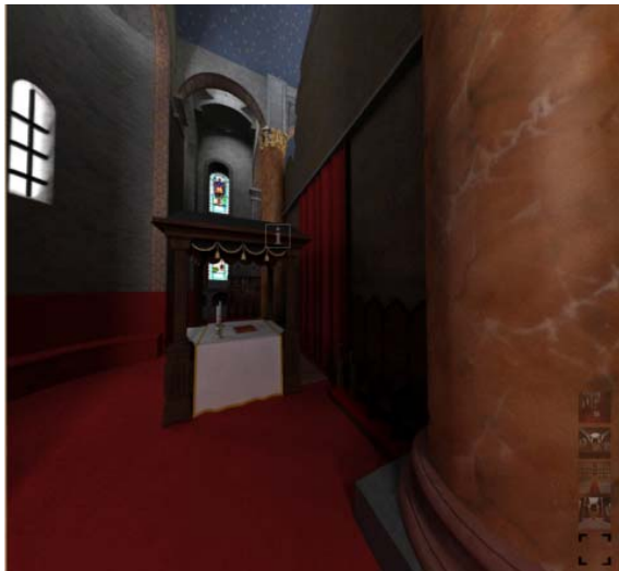
Slika 6. Virtuelni prikaz prostora iza oltara

Sam enterijer se sastoji od više odvojenih prostora tako da je eksportovano i više sferičnih panorama kako bi se sav prostor mogao prikazati. Vrlo interesantno je što smo na ovaj način bili u mogućnosti virtuelno predstaviti i prostor iza oltara (slika 6) u koji, po pravilima pravoslavne religije, nije dozvoljen ulaz vjernicima, nego samo sveštenicima koji pripremaju obred.