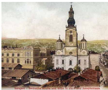
Slika. 1. Saborna crkva u Sarajevu

Saborna crkva Roždestva Presvete Bogorodice u Sarajevu jedan je od najvećih i najljepših pravoslavnih hramova na Balkanu. Nalazi se u samom centru Sarajeva. Odluka o gradnji Saborne crkve Roždestva Presvete Bogorodice u Sarajevu donijeta je početkom 1859. godine. Od 1859. pa do 1862. godine kupljeno je zemljište i materijal za gradnju crkve. Zemljište je kupljeno u ravnici, s desne strane rijeke Miljacke. Radovi na izgradnji katedre mitropolita dabrobosanskih započeli su 1863. godine po odobrenju sultana Abdula Aziza. Radovi na crkvi su trajali jedanaest godina. Potpuno je završena 1. maja 1874. godine. Saborna crkva je građena od dobrovoljnih priloga koji su sakupljani od 1863. godine pa do završetka gradnje. Priloge su davali pravoslavni građani Sarajeva, okolnih sela, trgovci iz Beograda, Dubrovnika, Beča i Trsta, a prema jednom podatku, prilog je dao i sam sultan Abdul Aziz sa 556 dukata. Gradnja crkve povjerena je Andreji Damjanovu, čuvenom neimaru iz Veleša, koji je takođe zidao Sabornu crkvu Svete Trojice u Mostaru, najljepšu i najveću crkvu na prostoru Bosne i Hercegovine, svojevremeno i Balkana a koja je u potpunosti srušena u toku rata 1992. godine.