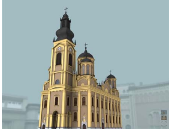
Slika 7. Flash animacija modela eksterijera

Prikaz interaktivnih modela objekata kulturnog naslijeđa kombinacijom Flash animacija pokazao se mnogo efikasnijim od VRML-a i ostalih sličnih web tehnologija, jer je vizuelni kvalitet modela očuvan, a fajlovi su mali i moguće ih je efikasno učitavati preko Interneta [2].