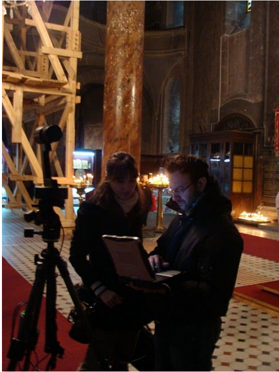
Slika 8. Spheron panoramska kamera