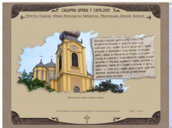
Slika 11. Početna stranica web prezentacije

Web stranica je kompletirana u programu Dreamweaver na što jednostavniji način kako svojom strukturom ne bi opterećivala učitavanje sa interneta (slika 11). To je značilo kreiranje jednostavnog CSS koda kojim su sadržaji fiksno pozicionirani, te međusobno odijeljeni.