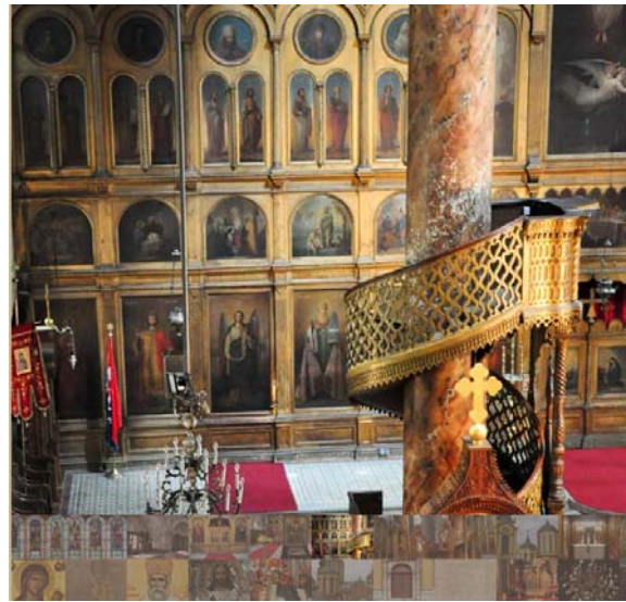
Slika 10. Galerija fotografija u okviru kreiranog web sajta Saborne crkve

riječ o više panoramskih slika, kao što je to ovdje bio slučaj. Takva scena eksportovana je kao zasebna stranica sa Flash fajlom te umetnuta u okvir postojećeg dizajna.