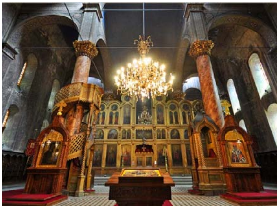
Slika 2. Unutrašnjost crkve zabilježena u okviru fotografisanja za naš projekat

Saborna crkva, iako nije oštećena u proteklom ratu, zbog svoje starosti nalazi se u fazi obnove i rekonstrukcije. Sama obnova unosi određene promjene u izgledu enterijera, prvenstveno podnih pločica, dok će rekonstrukcija zidova neumitno narušiti postojeće dekorativne elemente koji uveliko oplemenjuju unutrašnjost same crkve. Svrha izrade ove prezentacije je prvenstveno predstavljanje same crkve široj zajednici vjernika putem novih tehnologija, te bilježenje trenutnog stanja u kojem se crkva nalazi. U ovom projektu uključeno je također fotografisanje enterijera kako bi se moglo napraviti poređenje stanja prije i poslije rekonstrukcije saborne crkve. Za te potrebe kao i za potrebe texturisanja 3D modela urađeno je nekoliko stotina fotografija svih dijelova Saborne crkve (slika 2).