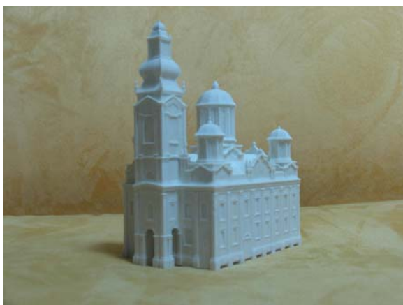
Slika 12. Prototip za izradu suvenira, Saborna crkva u Sarajevu

Trenutno se razmatraju opcije proizvodnje suvenira na bazi kreiranja prototipa, uzevši u obzir materijale, jednostavnost i cijenu procesa proizvodnje, te kvalitet i cijenu proizvedenih suvenira. Ovim procesom se onda mogu kreirati suveniri i za ostale objekte kulturnog naslijeđa čiji modeli su kreirani tehnikama kompjuterske grafike. [3, 4, 5].