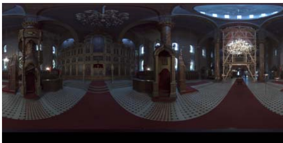
Slika 9. Panoramska fotografija uslikana kamerom Spheron

Galerija fotografija napravljena je u Flash-u uz upotrebu XML jezika kako bi se povezao niz fotografija koji je smješten u zasebnom folderu (slika 10).