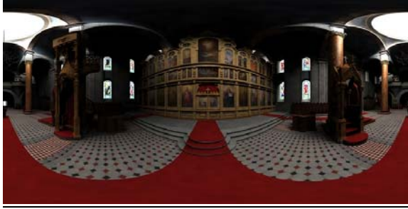
Slika 5. Sferična panorama modela enterijera

Sam enterijer se sastoji od više odvojenih prostora tako da je eksportovano i više sferičnih panorama kako bi se sav prostor mogao prikazati. Vrlo interesantno je što smo na ovaj način bili u mogućnosti virtuelno predstaviti i prostor iza oltara (slika 6) u koji, po pravilima pravoslavne religije, nije dozvoljen ulaz vjernicima, nego samo sveštenicima koji pripremaju obred.