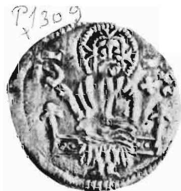
Сл. 23—24 — Динар деспота Бурђа Влковића, датиран на основу остава Erneszháza и Fülöpjakabszállás