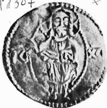
Сл. 17—18 — Динар Господина Бурђа Влковића — из оставе Ernesztháza