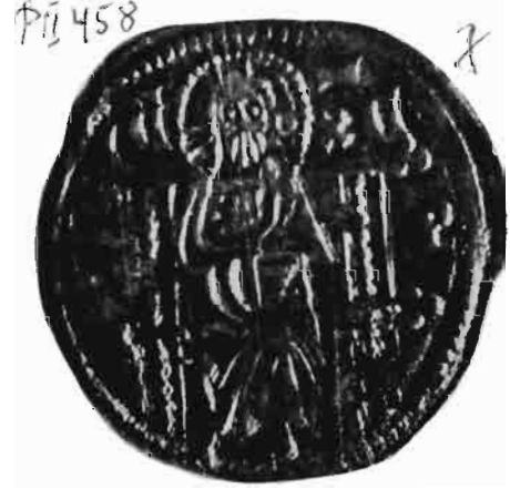
Сл. 11—12 — Динар цара Душана — из оставе Олтенија I