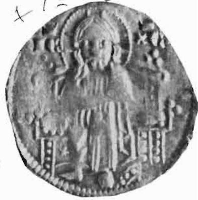
Сл. 37—38 — Динар краља Милутина — из оставе Vaskóhszíkasi