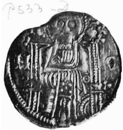
Сл. 1—2 — Динар краља Душана — из оставе Олгенија I