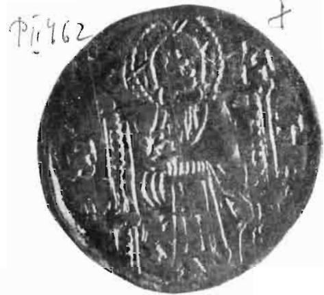
Сл. 9—10 — Динар цара Душана — из оставе Олтенија I