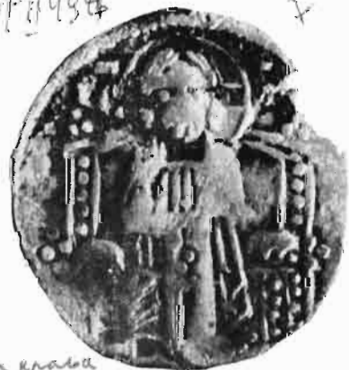
Сл. 35—36 — Динар краља Милутина — из оставе Vaskóhsziklasi