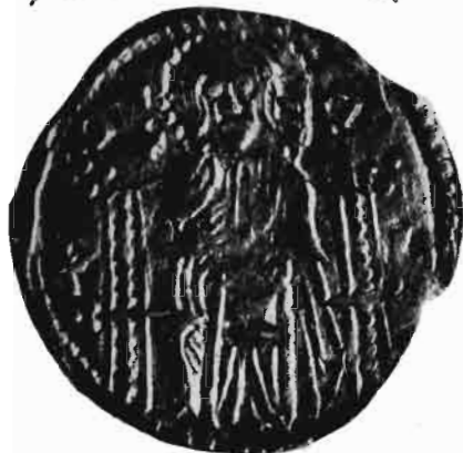
Сл. 13—14 — Динар Слуге Бранка (Младеновића) — из оставе Олтенија I