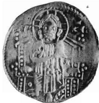
Сл. 41—42 — Динар краља Милутина — из оставе Vaskóhszíkasi