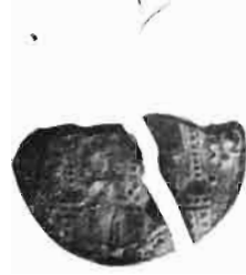
Сл. 43 — Динар краља Драгутина из оставе Амнаш