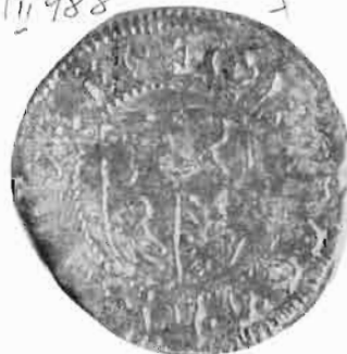
Сл. 29—30 — Заједнички новчић деспота Бурђа Влковића и Јанка Хуњадија, из оставе Дериња (галванопластичка копија)