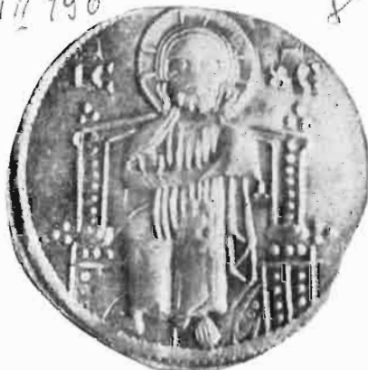
Сл. 31—32 — Динар краља Уроша I или краља Милутина — из оставе Vaskóhsziklasi