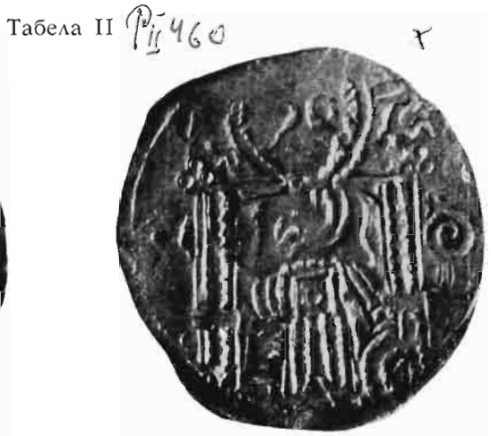
Сл. 7—8 — Динар Душана као краља Рашана и цара Византинаца — из оставе Олтенија I