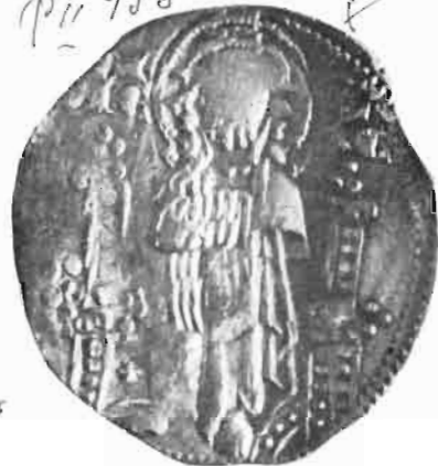
Сл. 39—40 — Динар краља Милутина — из оставе Vaskóhszíkasi