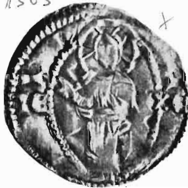
Сл. 15—16 — Динар деспота Стефана Лазаревића — из оставе Ernesztháza