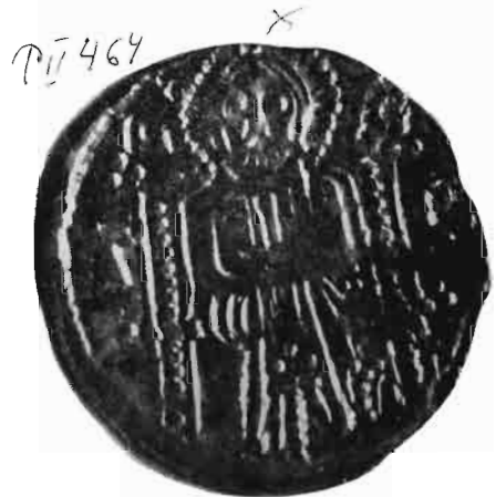
Сл. 3—4 — Динар краља Душана — из оставе Олгенија I