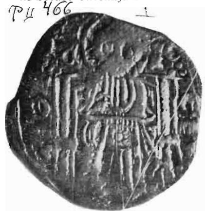
Сл. 5—6 — Динар краља Душана — из оставе Олгенија I