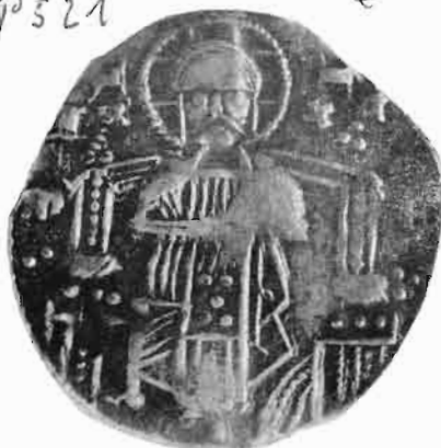
Сл. 25—26 — Динар краља Драгута — из оставе Обал