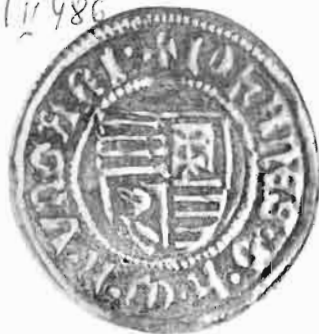
Сл. 27—28 — Заједнички новчић деспота Бурђа Влковића и Јанка Хуњадија (прва врсга)