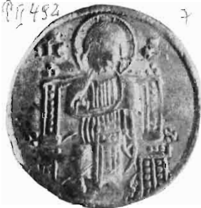
Сл. 33—34 — Динар краља Уроша I или краља Милутина — из оставе Vaskóhsziklasi