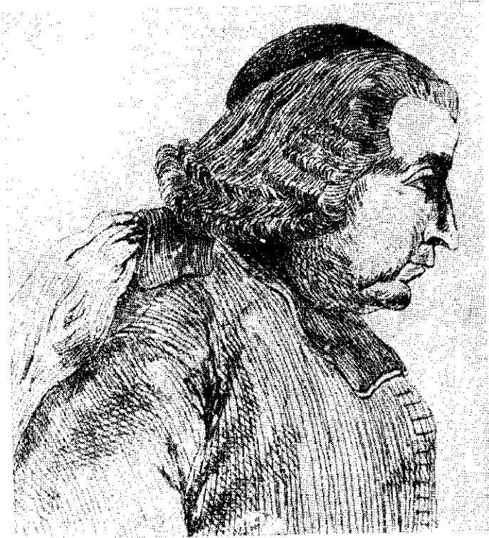
РУЂЕР ЈОСИФ БОШКОВИЋ