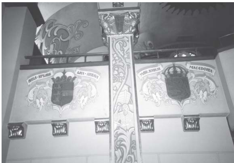
Слика 10. Зидно сликарство у храму св. Стефана Првовенчаног у Алхамбри