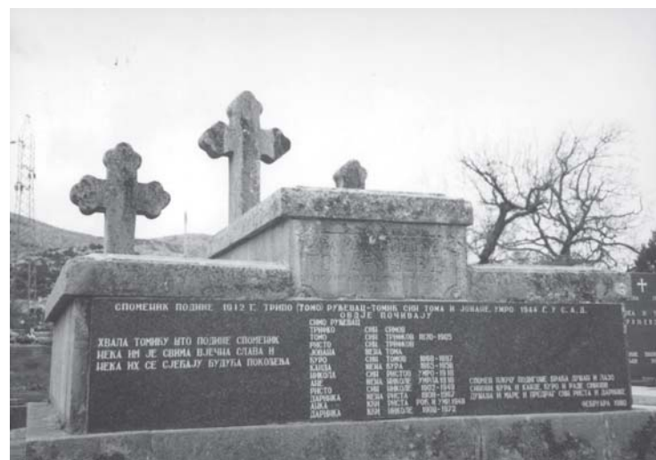
Слика 7. Споменик на гробљу у Петровом пољу поред Требиња (Херцеговина)