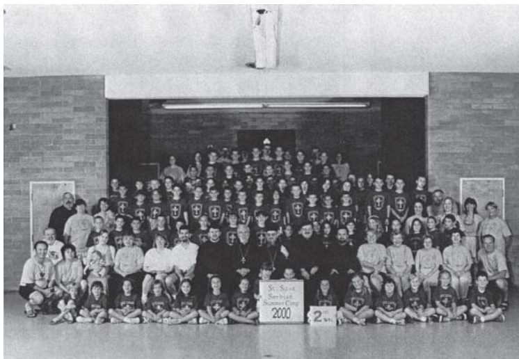
Слика 19. Дечји камп у Џексону