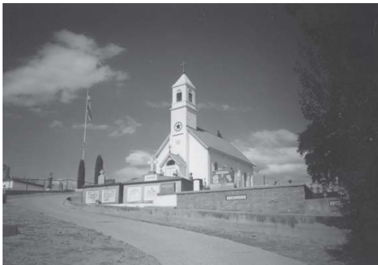
Слика 5. Црква светог Саве, Џексон