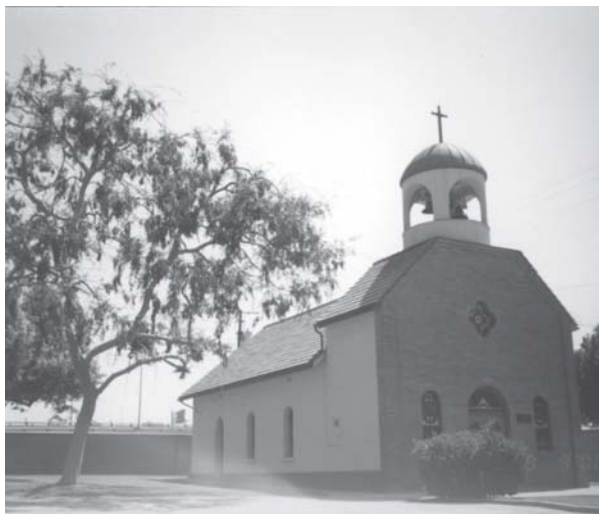
Слика 1. Црква св. Саве на Српском гробљу у Лос Анђелесу