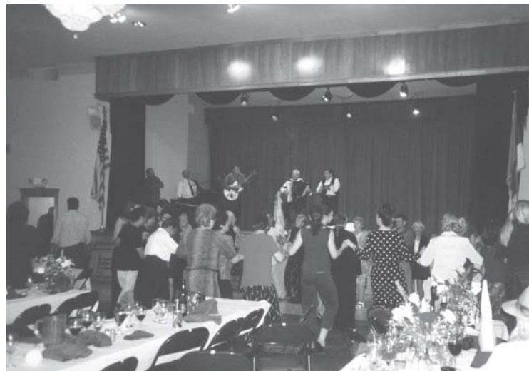
Слика 31. Игранка у парохијском дому цркве св. Саве у Сан Габријелу