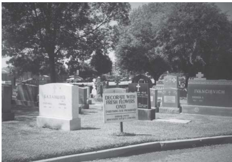
Слика 6. Гробљанским прописима регулисано је да се гроб украшава само свежим цвећем