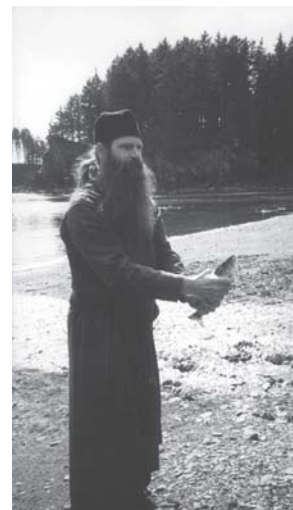
Слика 15. Монах у скиту св. Архангела Михаила на острву Спрус Ајланд