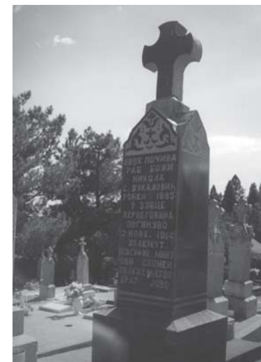
Слика 8. Надгробни споменик у Џексону