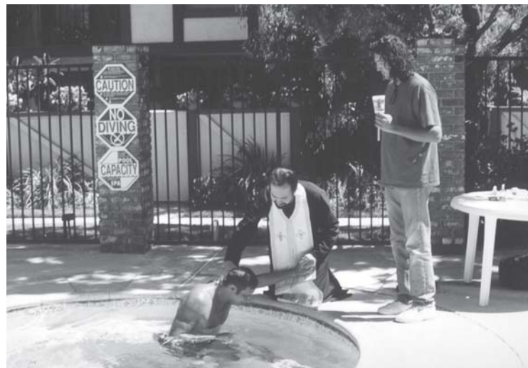
Слика 26. Крштење у базену