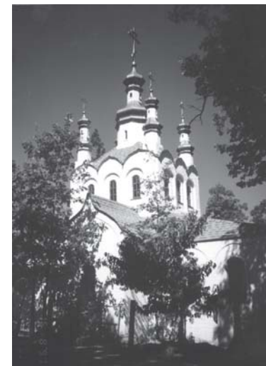
Слика 16. Мушки општежитељни манастир св. Германа Аљаског, Платина