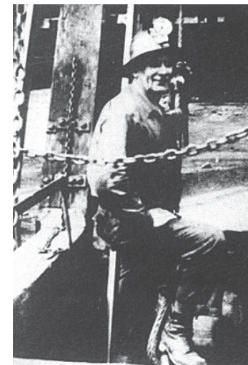
Слика 22. Српски рудар у Калифорнији почетком 20. века