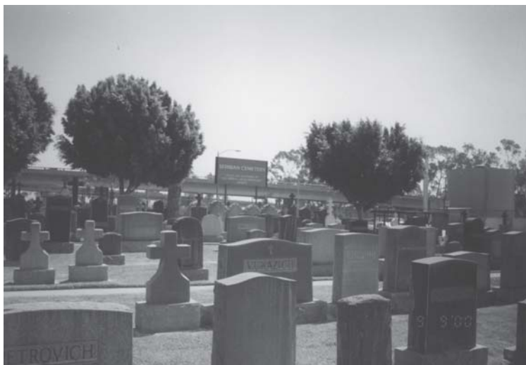
Слика 2. Српско гробље у Лос Анђелесу – амерички закони одређују висину надгробног споменика који су углавном у облику плоче или крста