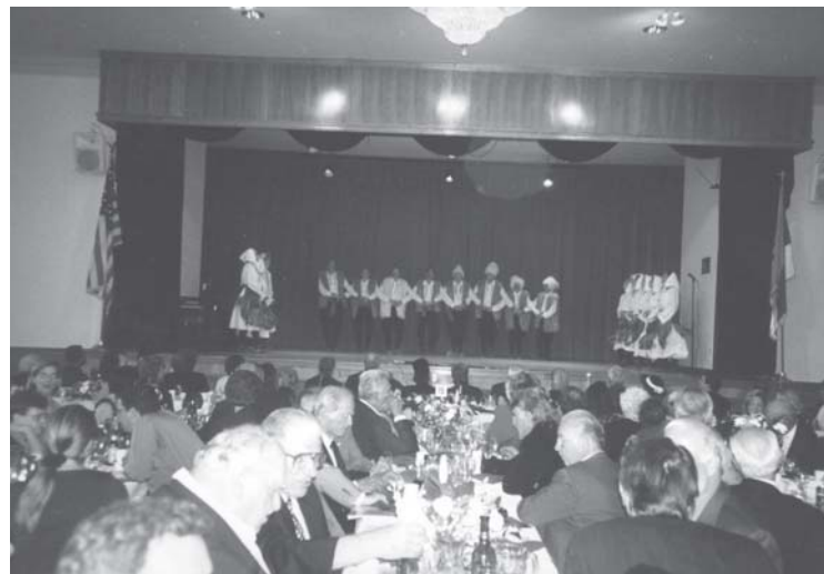
Слика 30. Фолклорна група у парохијском дому цркве св. Саве у Сан Габријелу