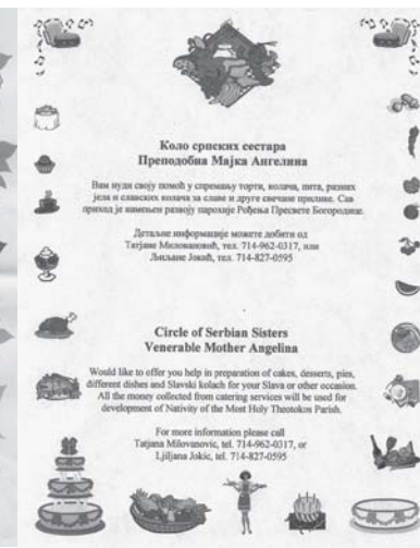
Слика 18. Реклама КСС парохије Рођења Пресвете Богородице, Оринџ Каунти