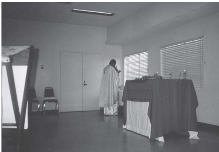
Слика 13. Парохија Рођења Пресвете Богородице, Оринџ Каунти