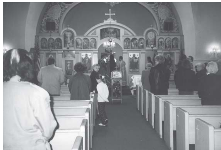
Слика 12. Унутрашњост цркве св. Апостола Петра, Фрезно