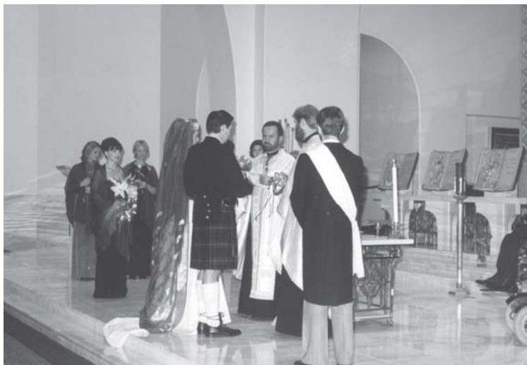
Слика 28. Венчање Шкотланђанина и Српкиње у парохији Рођења Пресвете Богородице