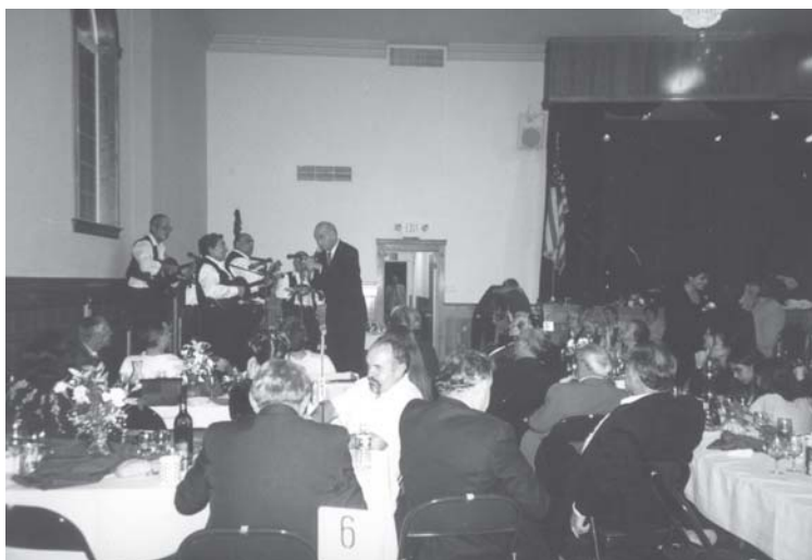
Слика 29. Прослава у парохијском дому цркве св. Саве у Сан Габријелу