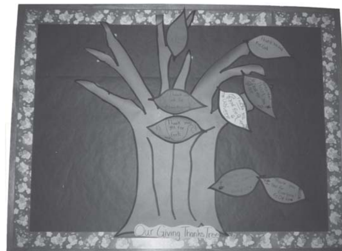
Слика 23. Дечије дрво захвалности направљено на веронауци поводом Дана захвалности