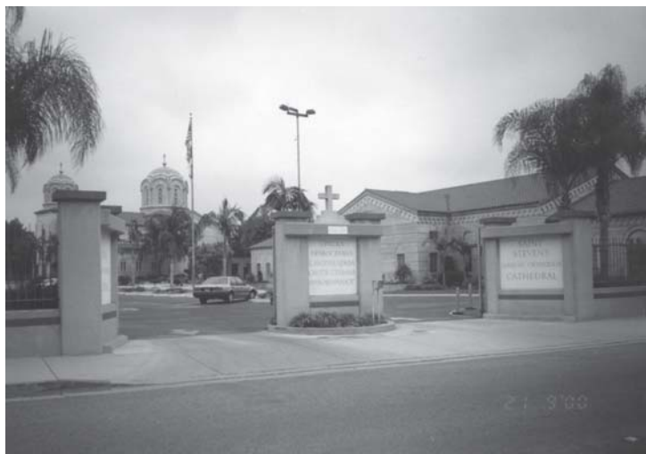
Слика 9. Црква св. Стефана Првовенчаног, Алхамбра (Лос Анђелес)