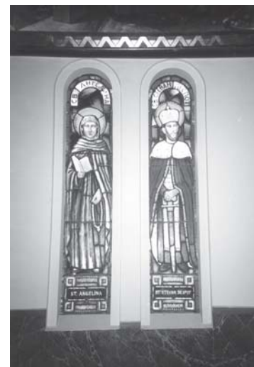
Слика 11. Витражи у храму св. Стефана Првовенчаног у Алхамбри