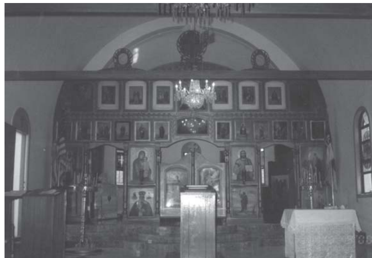
Слика 3. Иконостас у цркви св. Саве на Српском гробљу у Лос Анђелесу састављен од папирних репродукција икона које су први досељеници донели са собом