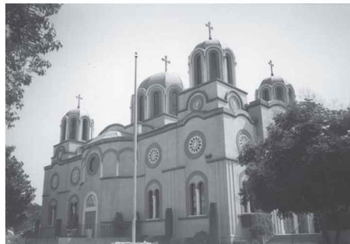
Слика 4. Црква светог Саве, Сан Габријел