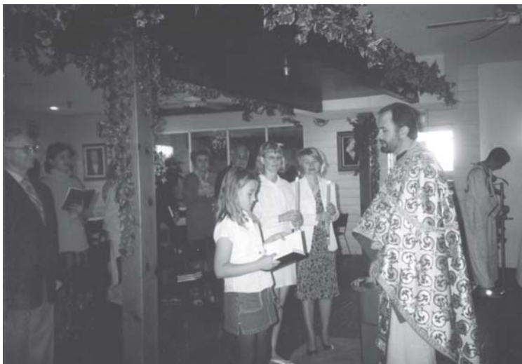
Слика 25. Новокрштена девојчица чита Апостол