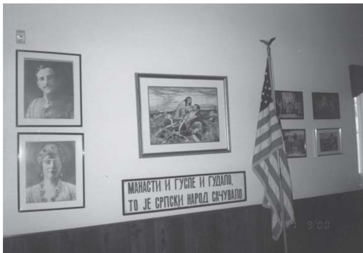
Слика 14. Детаљ из парохијског дома при цркви св. Петке у Сан Маркосу