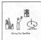
Слика 20. Из уџбеника за веронауку: опис крсне славе у облику стрипа – Петрова слава (Peter's Slava)