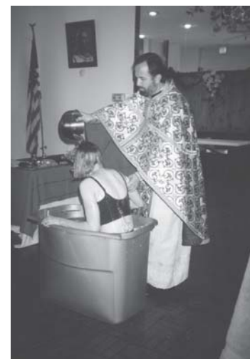
Слика 27. Крштење у импровизованој крстионици за одрасле