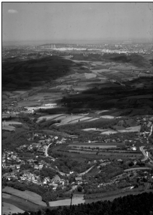
Слика 1: Панорама Ранко Баришић, 1980.