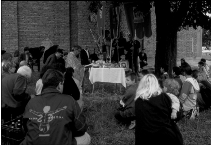
Слика 14: Литија Ранко Баришић, Зуце, 2002.