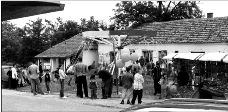
Слика 18: Сеоска слава Ранко Баришић, Зуце, 2002.