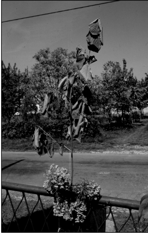
Слика 13: Ђурђевдан Ранко Баришић, Зуце, 1998.