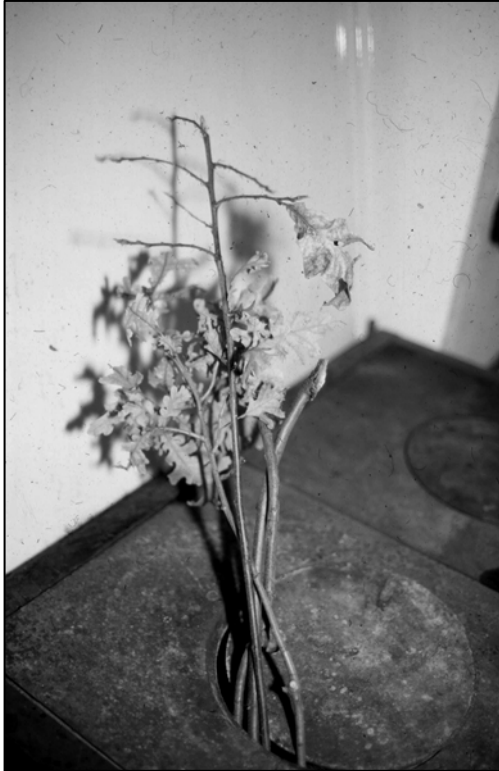
Слика 3: Бадњак Ранко Баришић, Зуце, 1998.