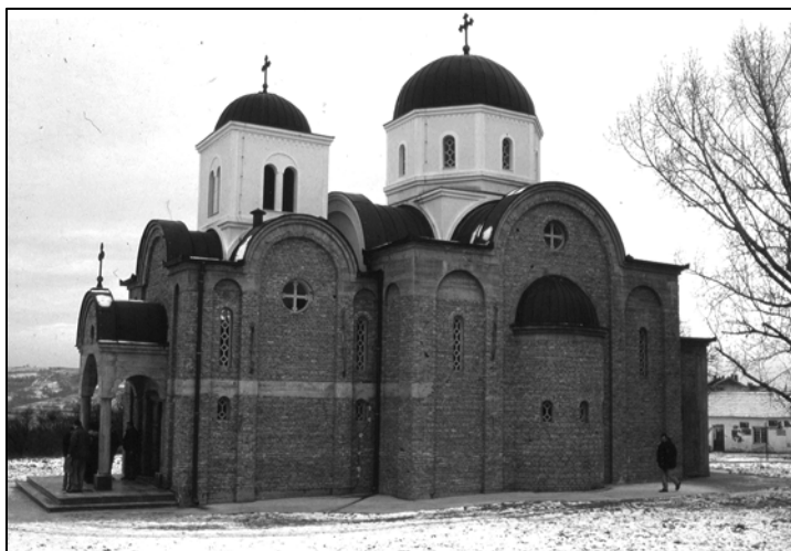
Слика 2: Сеоска црква у Зуцима Ранко Баришић, 1997.